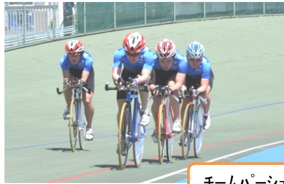
チームパーシュート