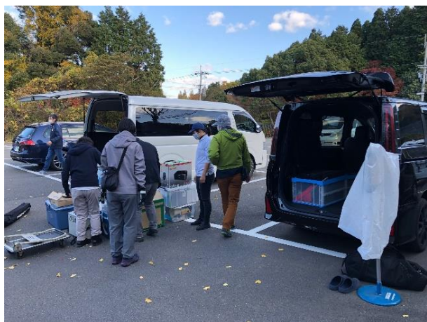
借り上げ車両（2台） 終了後の積み込み