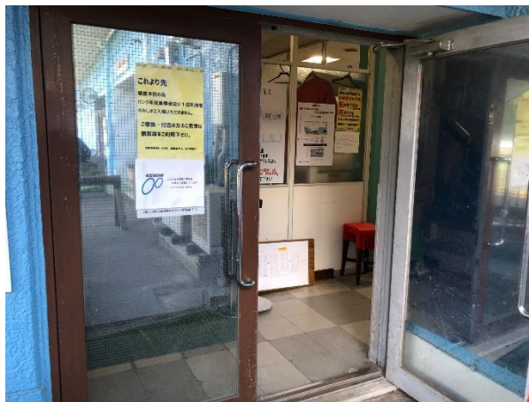
会場入り口（サイクルセンターバンク入り口）