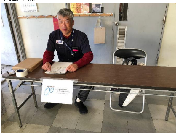
選手・競技役員 受付