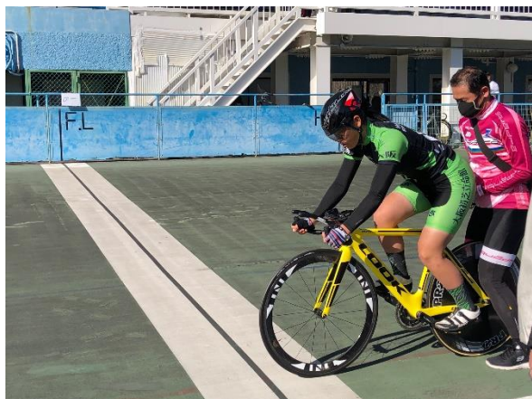
スタート・フィニッシュライン延長線上に補助事業表示