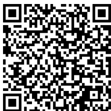
申し込みフォーム QR コード

https://docs.google.com/forms/d/e/1FAIpQLSfMWo-eatRthAaG6aQzc9tE6dUpo5tIjmIy3KjxVvq6KFEsuw/viewform?usp=pp_url